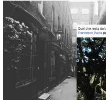
Quel che resta della casa di Trockij a Büyüklada fibrata dal dolce fico. Grazie a Francesco Pasta per una Istanbul speciale